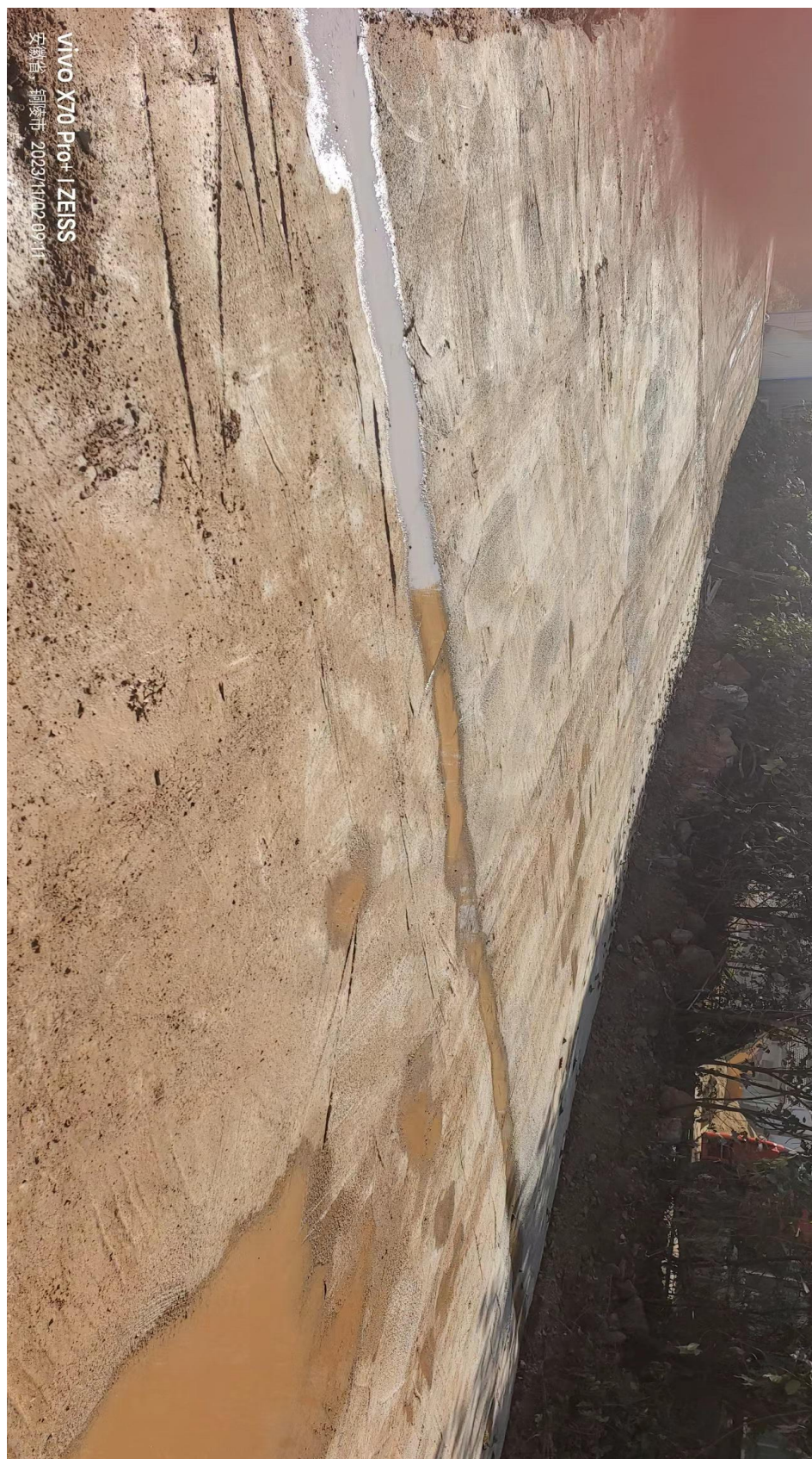
开挖排水沟，保持排水、收集畅通