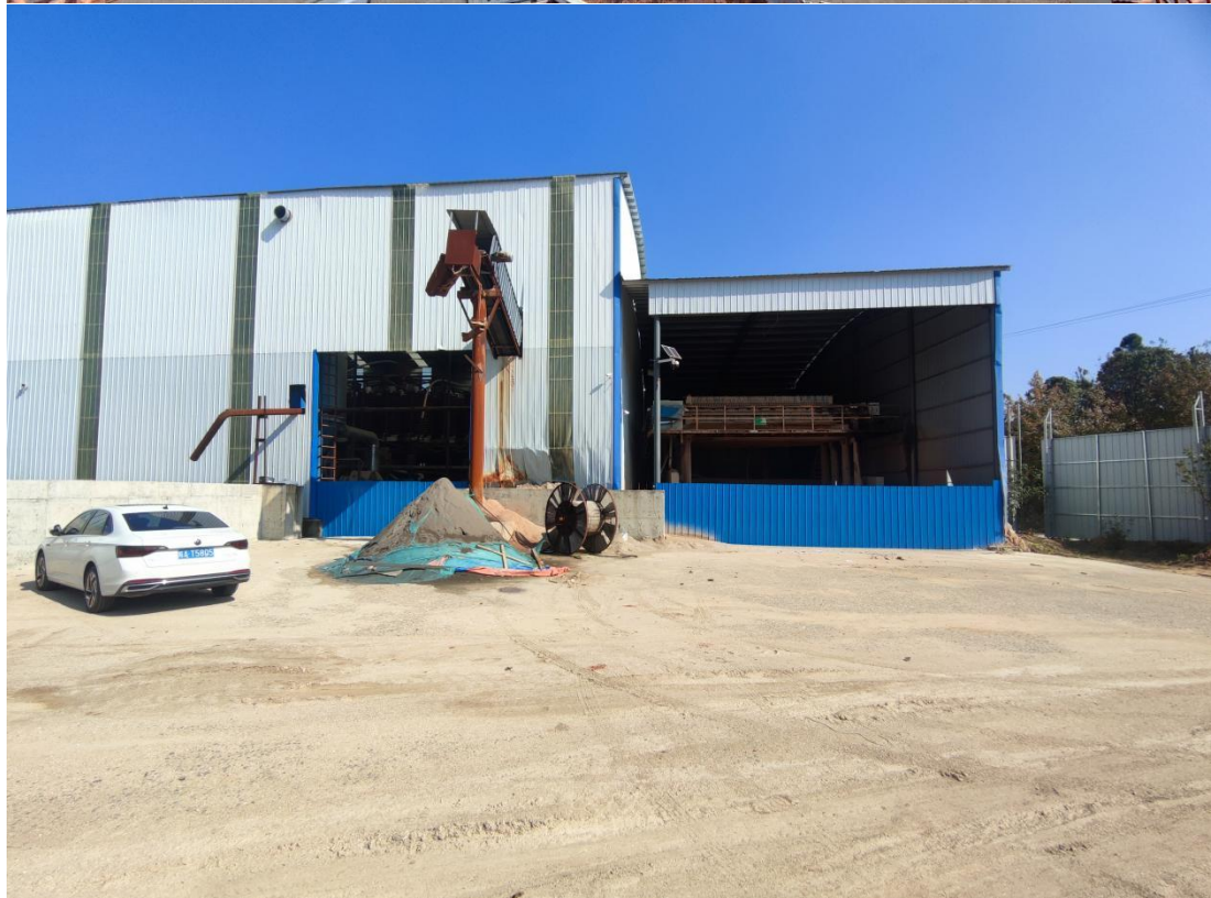
企业自主停止加工设备生产线，并拆除生产设备