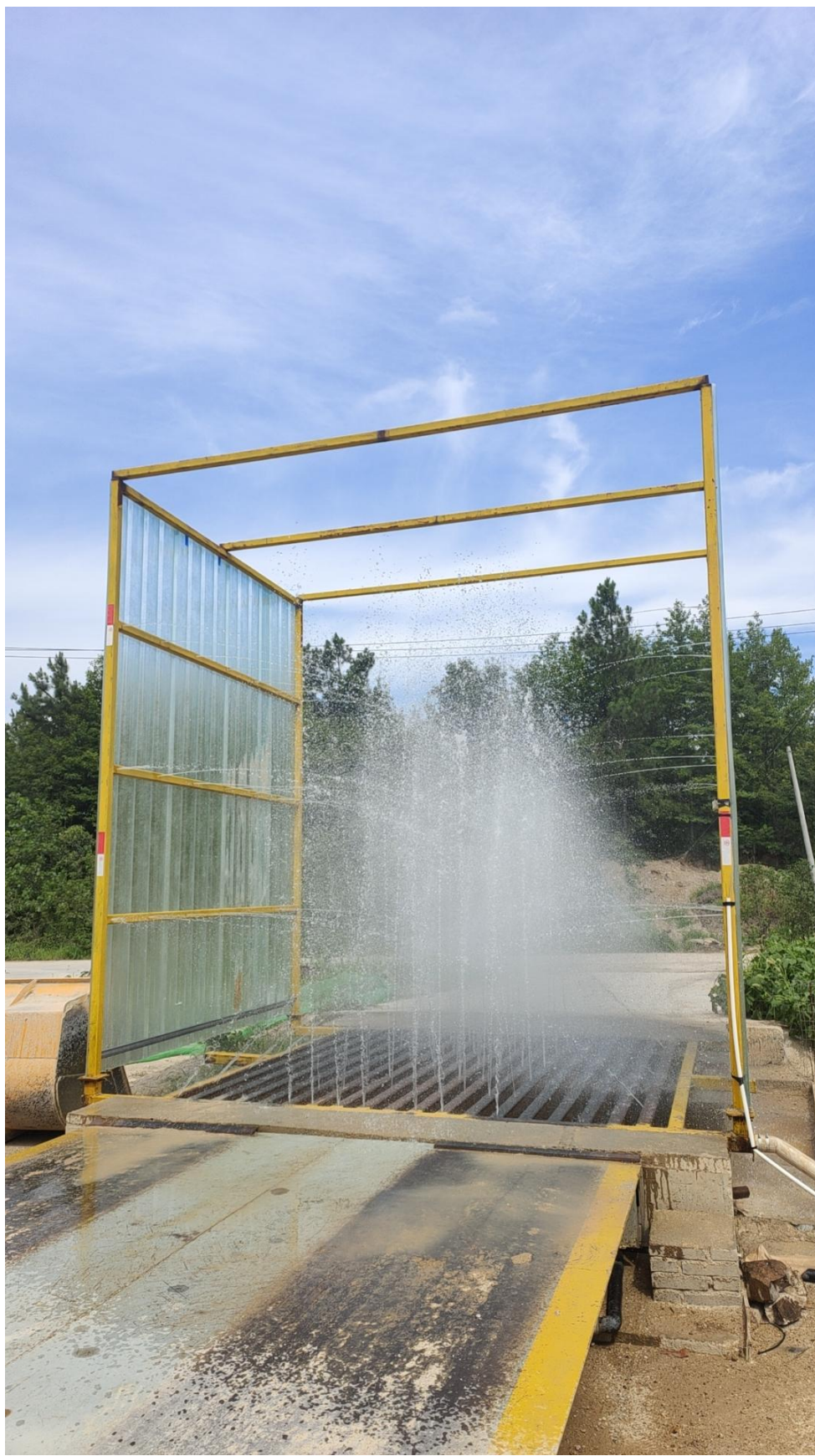
车辆感应式自动冲淋装置和遮挡板