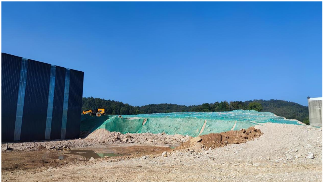
2200m 2 密闭物料堆库和现场覆盖管理