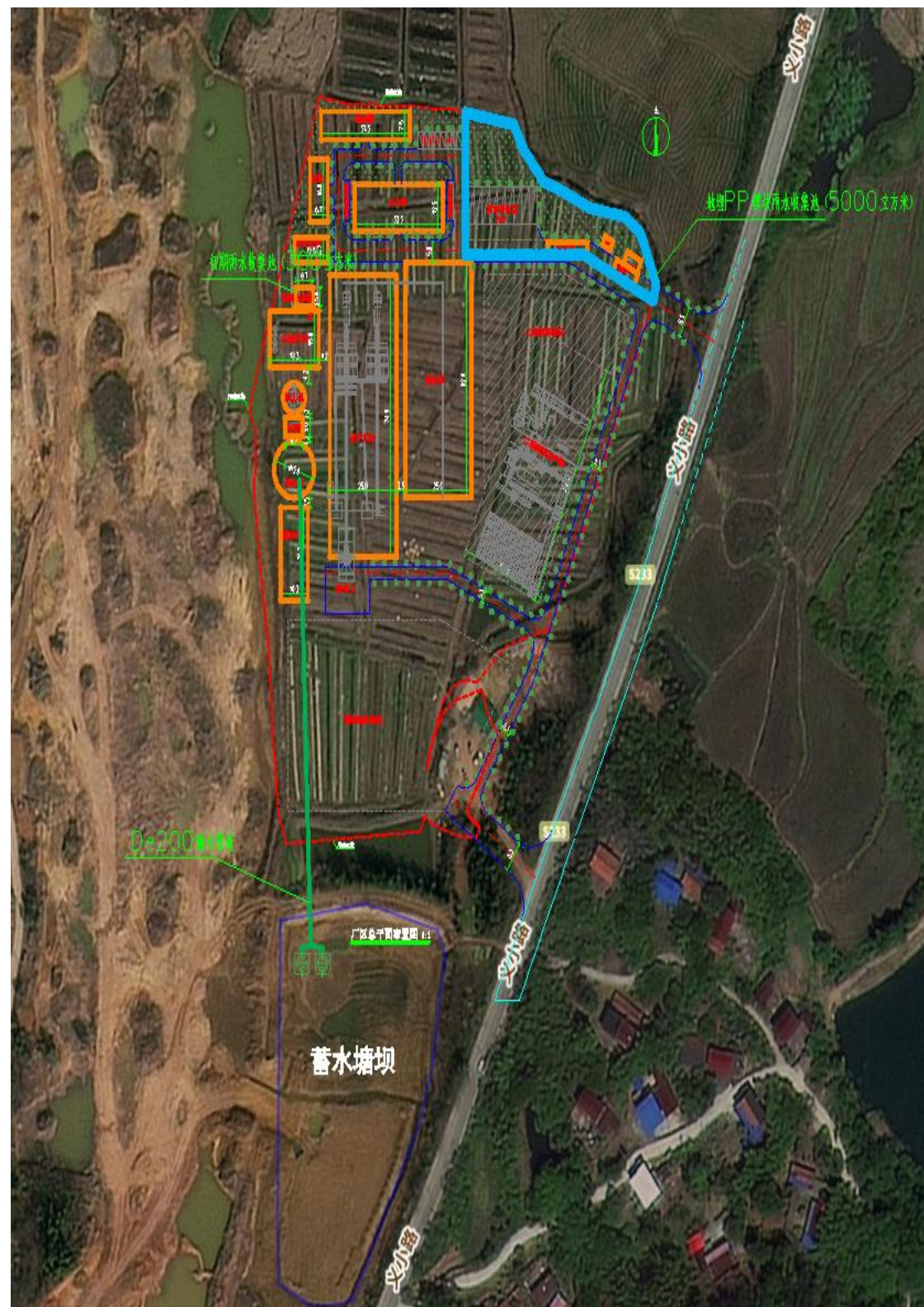
附图 1: 雨水收集再利用布置图