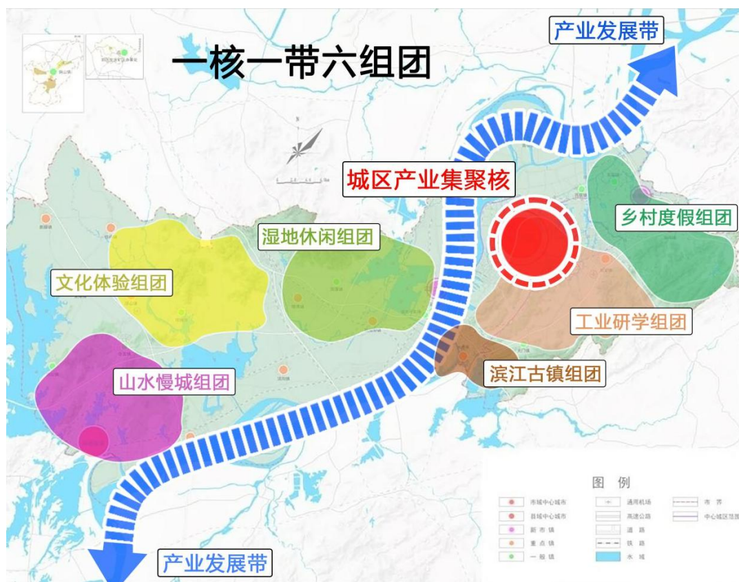
图 1 旅游产业空间布局图