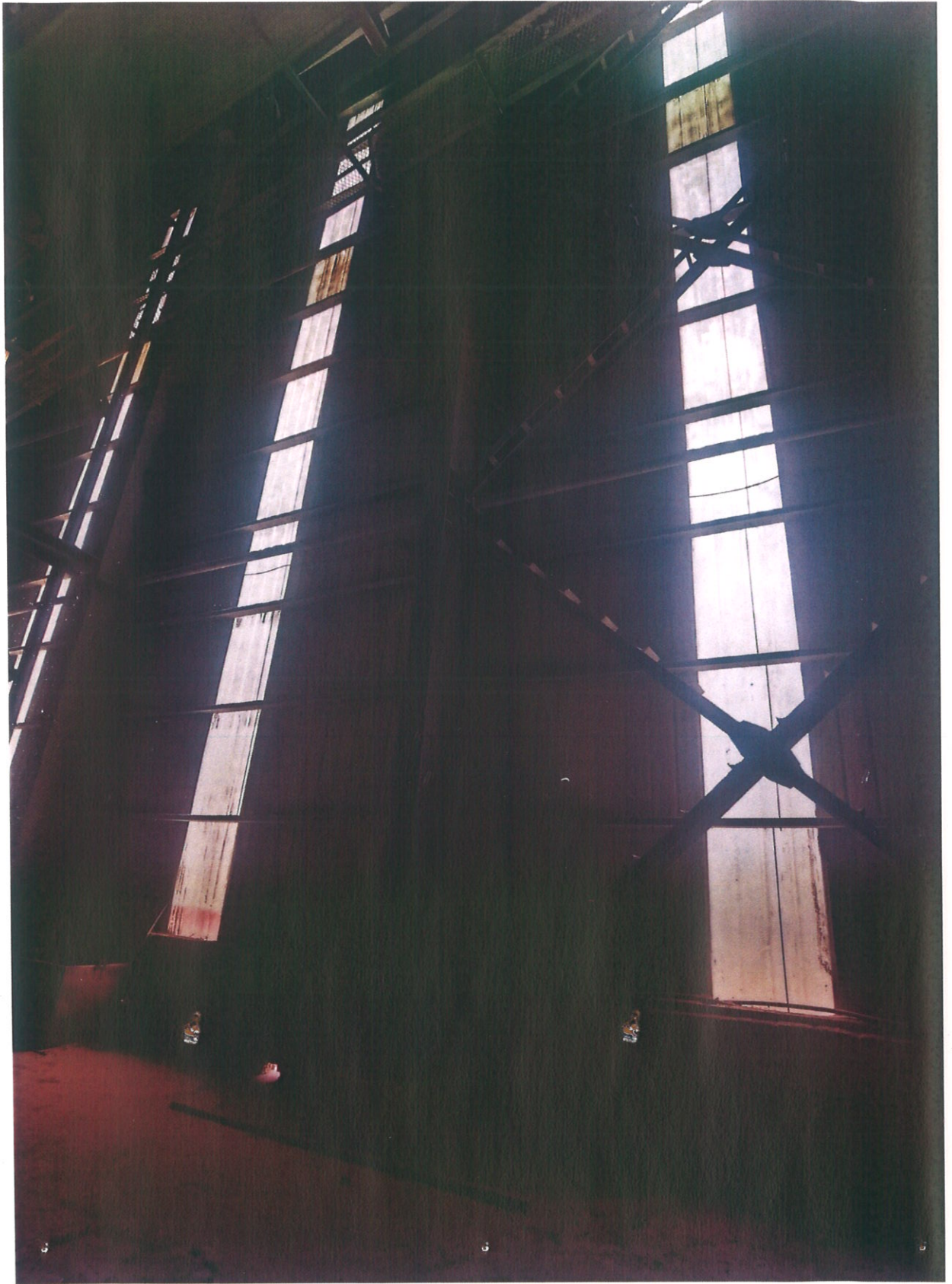
整改后：筛分车间破损已全部修复