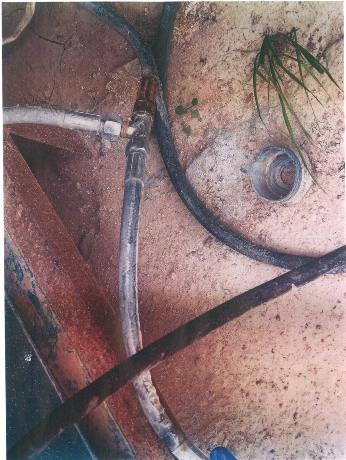
整改后：尘管连接管连接