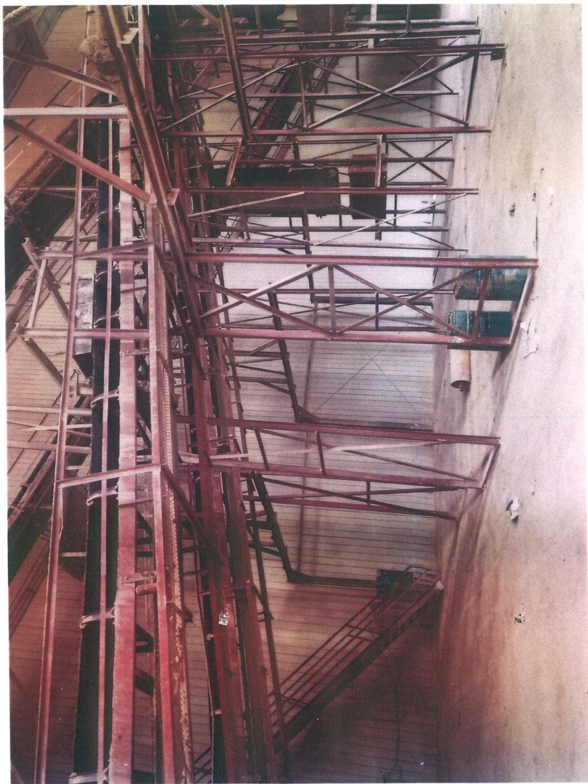
整改后：设备和地面除尘已全面清理