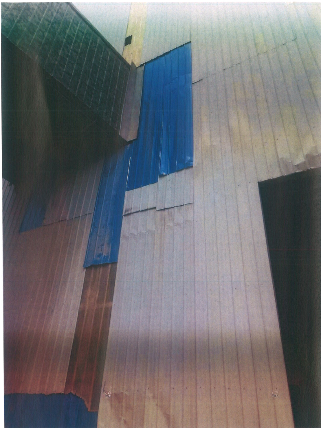
整改后：筛分车间破损已全部修复