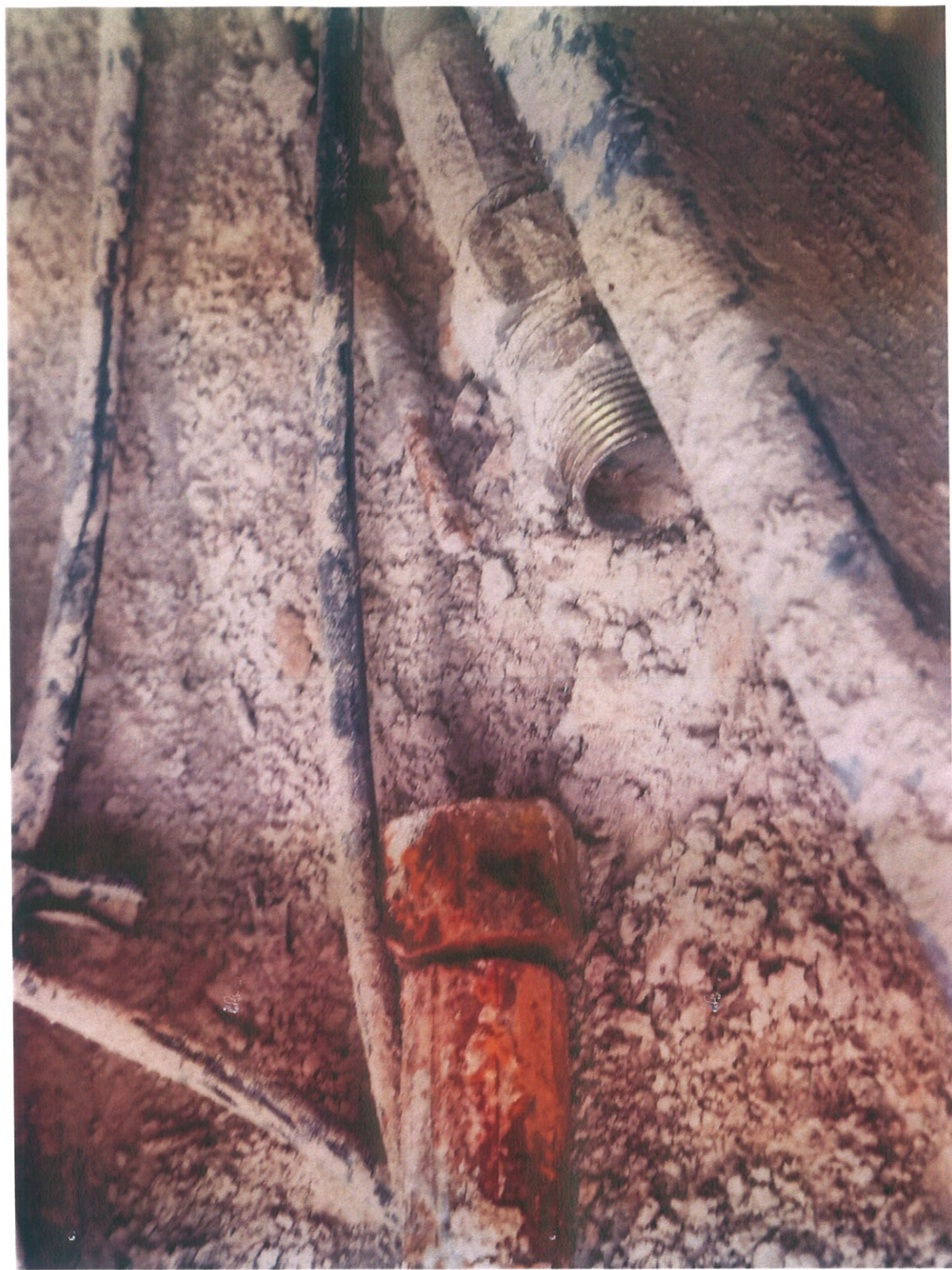
除尘管连接管分开