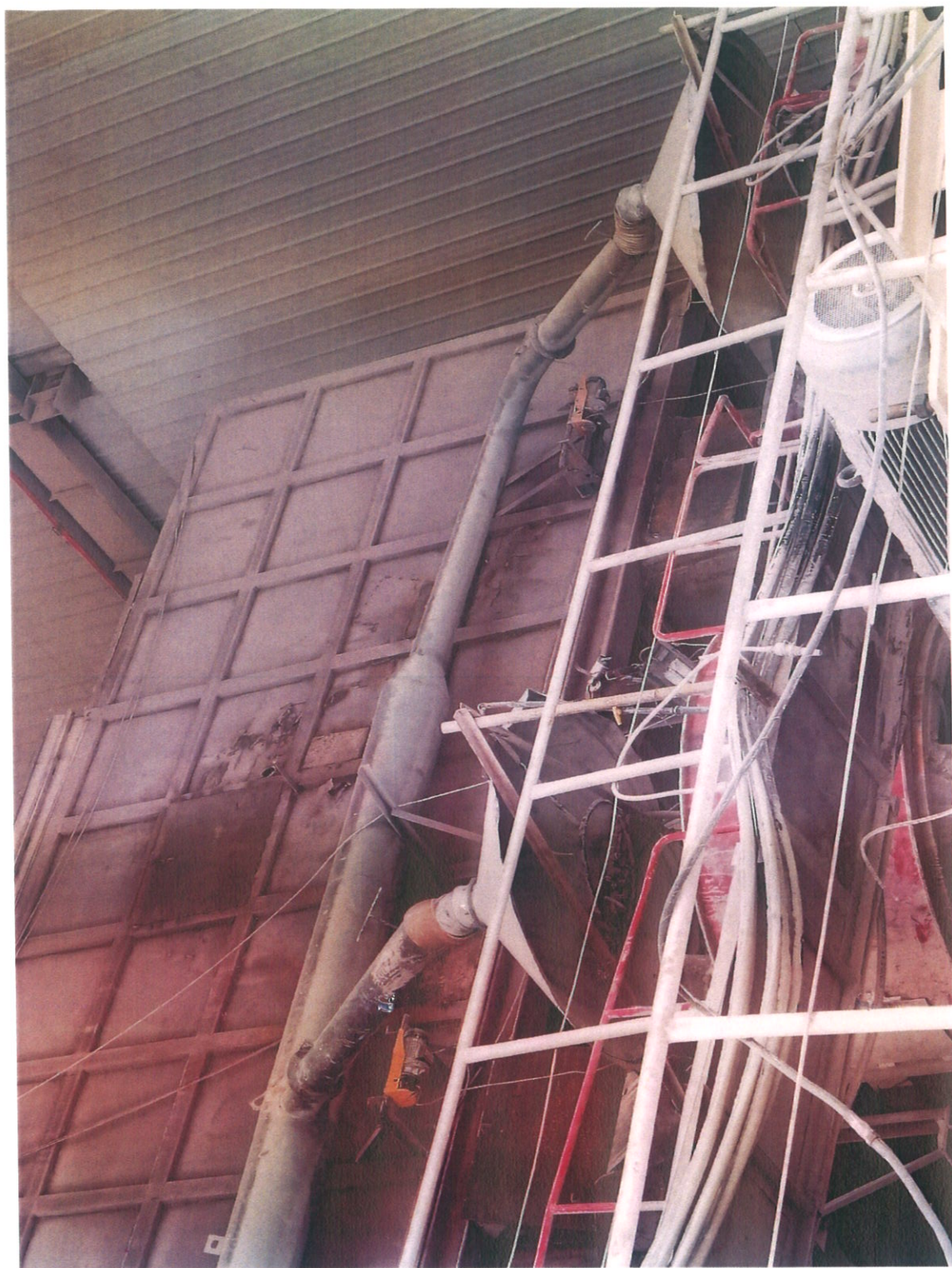
整改后：除尘管连接管已修复